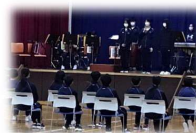
1年生を迎える会での一場面